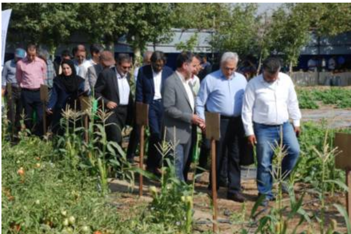
تصاویری از تور آموزشی برگزار شده با همکاری شرکت مواد زراعی ایران