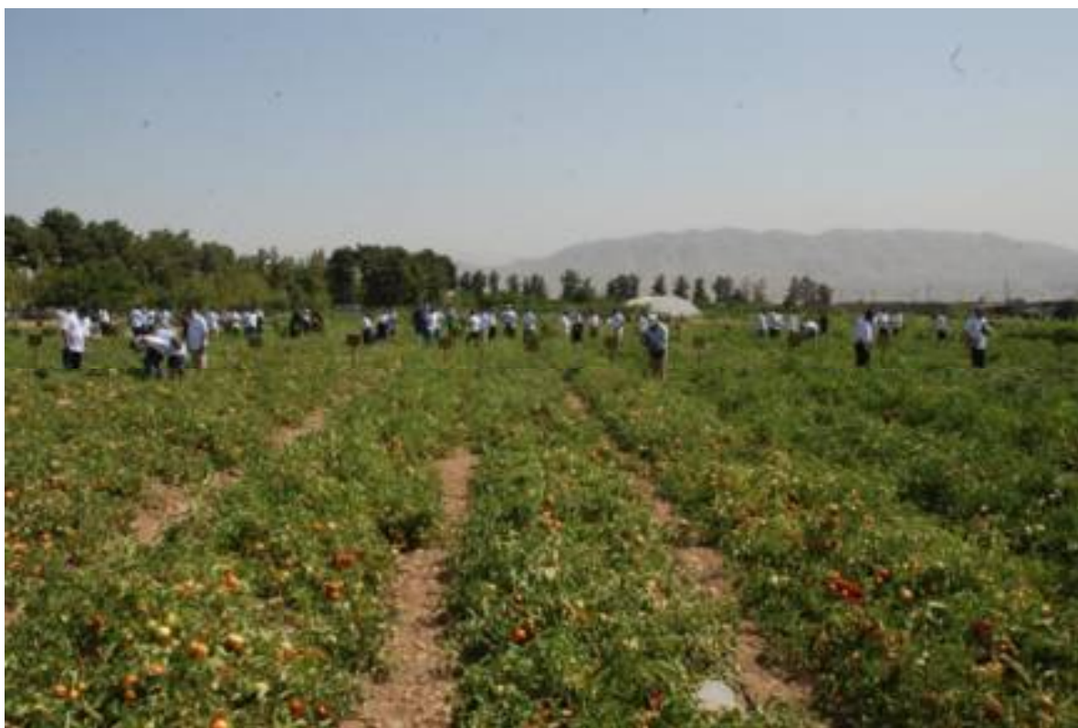
تصاویری از تور آموزشی برگزار شده با همکاری شرکت مواد زراعی ایران