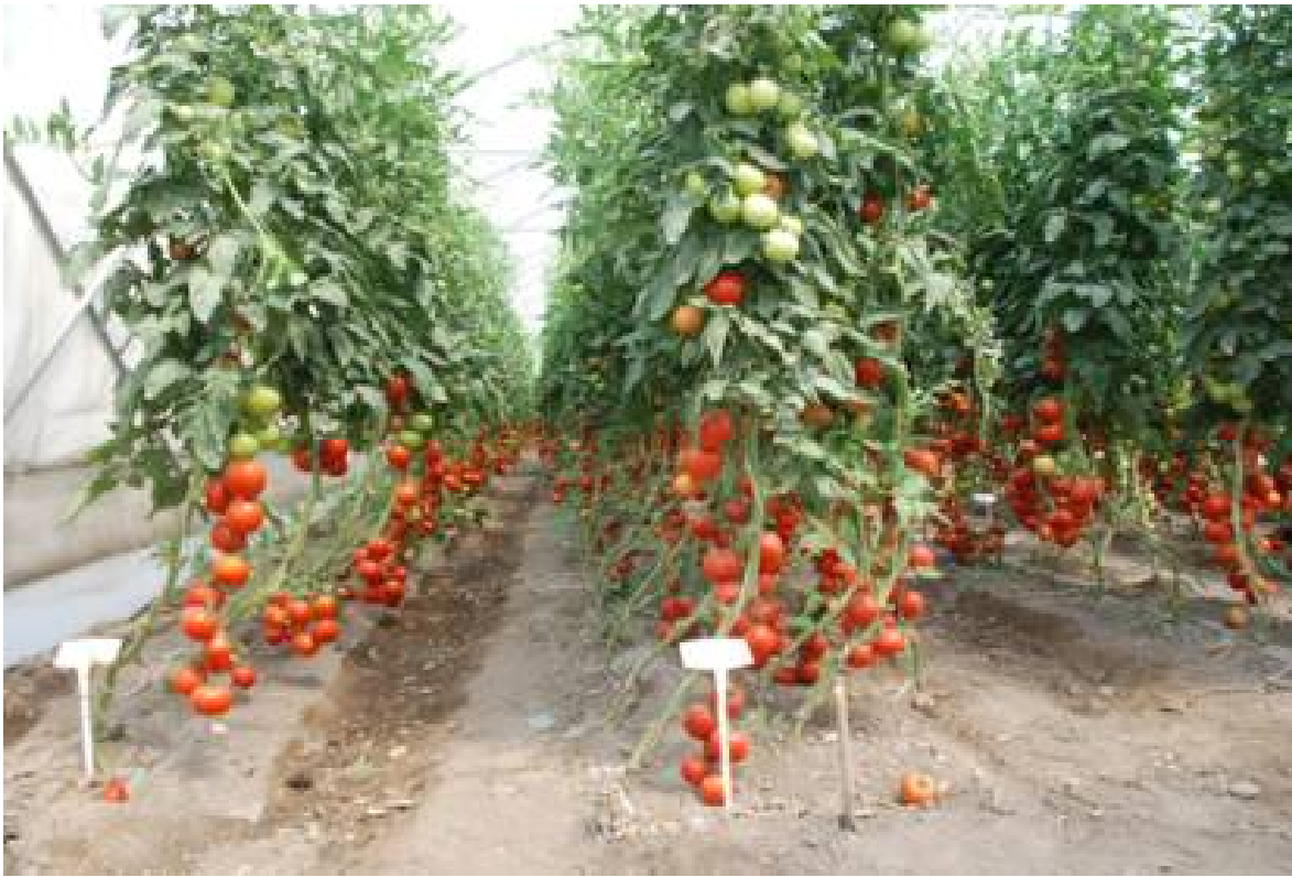
تصاویری از تور برگزار شده با همکاری شرکت‌های آراین خوشه پارس و دلتا پارس نهاده