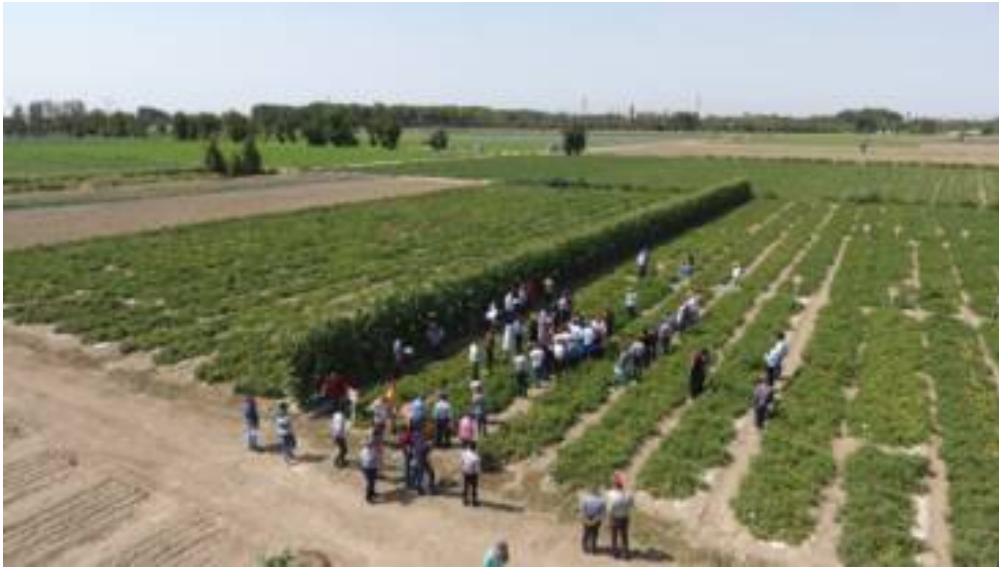
تصاویری از اولین تور آموزشی برگزار شده با همکاری شرکت فلات